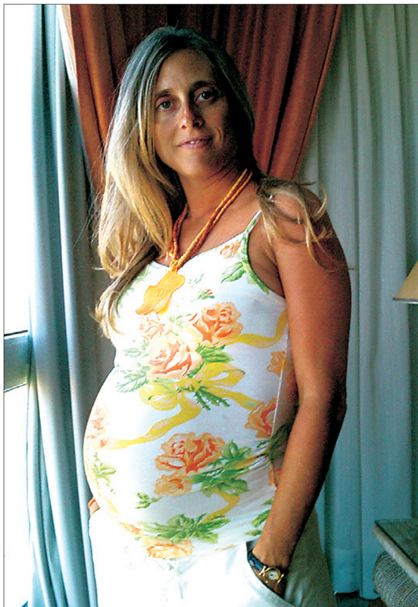
Cuidados. Una mujer embarazada.

En algunos casos, pueden llegar a formarse lesiones conocidas como granulomas o éupulis del embarazo, que se observa como encías muy inflamadas, sangrantes y dolorosas que pueden llegar a crecer hasta el punto que deben extirparse quirúrgicamente, situación que debe evitarse al máximo durante el embarazo, en muchos casos se presenta pérdida ósea alrededor de los dientes causado por piorrea o periodontitis.